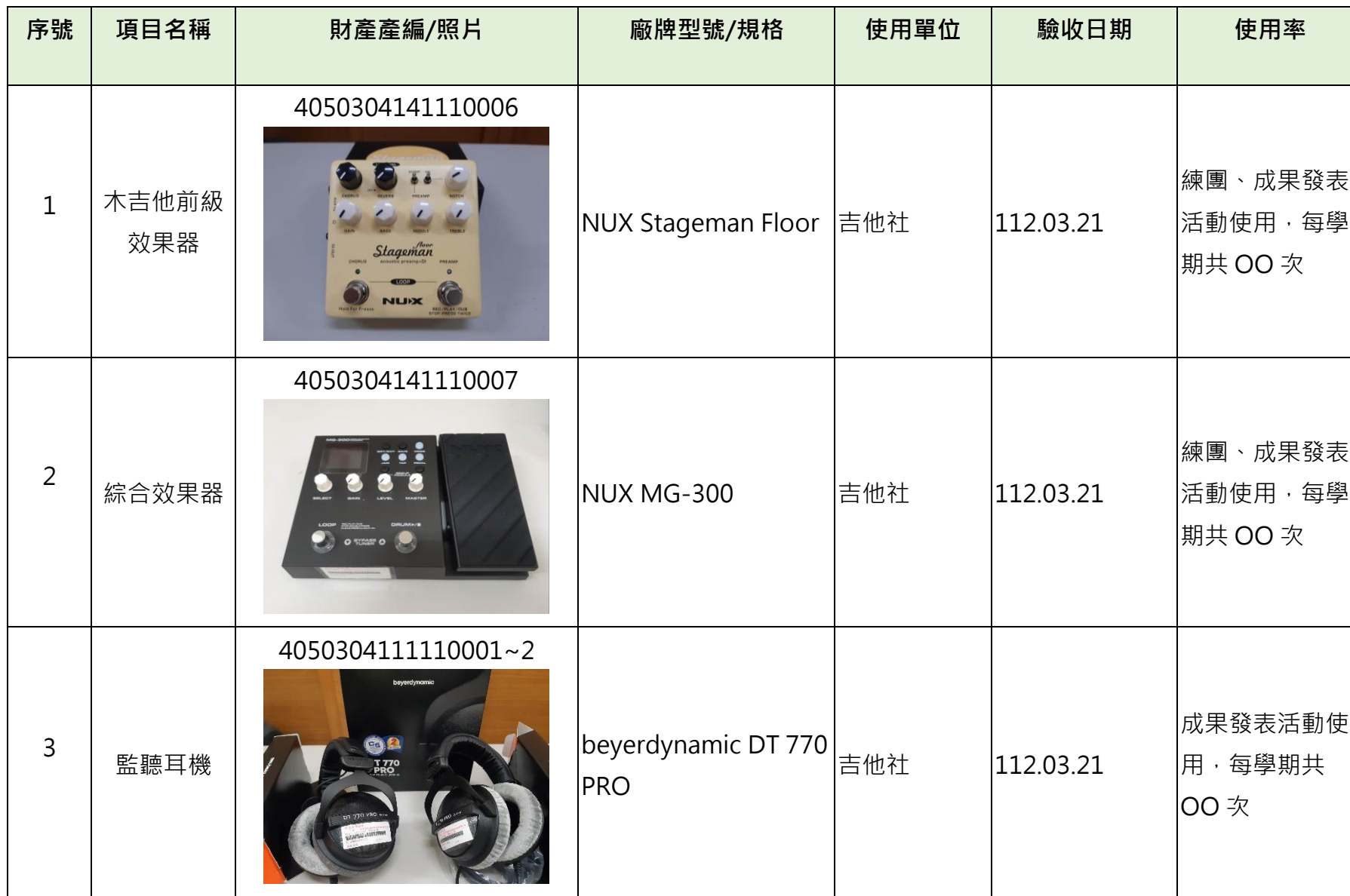
靜宜大學 112 年度校務發展獎補助款社團設備彙整表