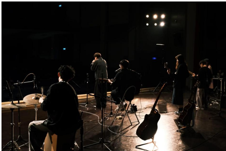
113/03/14 期初成發 (木吉前級效果器、EGO 導線、神鳴導線)